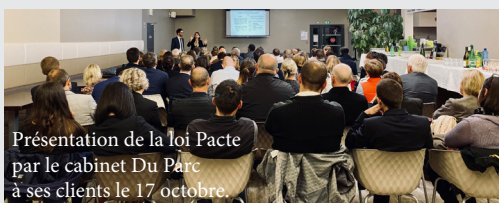
Présentation de la loi Pacte par le cabinet Du Parc à ses clients le 17 octobre

À cette fin, l'article 1.835 du Code civil a été modifié et permet désormais aux sociétés d'insérer dans leurs statuts une « raison d'être », constituée « des principes dont la société se dote et pour le respect desquels elle entend affecter des moyens dans la réalisation de son activité ». Autrement dit, la recherche et le partage du profit peuvent, si les associés le souhaitent, être conciliés avec le respect de certaines valeurs. Allant plus loin, le nouvel article L.210-10 du Code de commerce permet aux sociétés volontaires