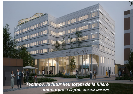
Technov, le futur lieu totem de la filière numérique à Dijon.

● Labellisée Territoire d'Innovation, la métropole se distingue également dans l'innovation agroécologique et la transition alimentaire. AgroNov , lieu totem de l'agroécologie, fédère recherche, formation et entreprises autour des enjeux